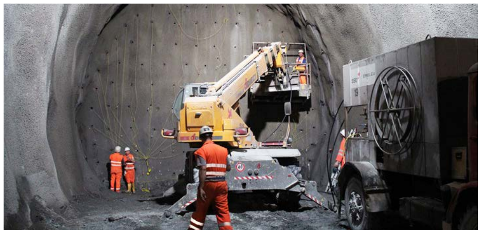
Die Arbeiten am Tunnel sind in vollem Gange.

Am 29. November findet in der Kammergeschäftsstelle das nächste Fachforum aus dem Bereich Ingenieurgeologie und -geotechnik statt. Es erwartet Sie ein Vortrag über Geotechnik im Tunnelbau sowie Workshops über Probleme beim Aushub bzw. Vortrieb und Ingenieurgeologische Schlüsselprobleme beim Tunnelbau im Untergrund. Die Teilnahme ist kostenfrei. Eine Anmeldung ist erforderlich.