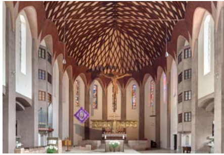
Silber - Öffentliche Bauwerke Kath. Pfarrkirche St. Anton - Augsburg

Insbesondere beim Aufbau des Brückenbelags erfolgte eine detaillierte Betrachtung der unterschiedlichen Materialeigenschaften mit ihren Vor- und Nachteilen. Ein besonderes Augenmerk wurde auf die Dauerhaftigkeit, die Reparaturfähigkeit und die Nutzung regionaler und natürlicher Baustoffe gelegt. Durch die gewählte Instandsetzungsart ist der langfristige Erhalt des Baudenkmals gesichert.