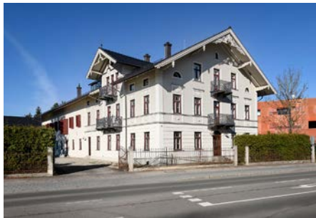
Silber - Private Bauwerke Beim Fuchs - Unterföhring

Kernaufgabe der Projektbeteiligten war es, die durch die Hanglage entstandenen Feuchteschäden dauerhaft zu beheben. Erreicht wurde dies durch das Versetzen des Hauses. Die Entwicklung, Ausarbeitung und Abwägung der Optionen für die Instandsetzung, die Konzeption der für das Verschieben nötigen baulichen Maßnahmen und die Umsetzung stellen eine außergewöhnliche Ingenieurleistung dar.