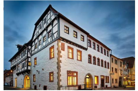
Bronze - Öffentliche Bauwerke Museum - Karlstadt

Durch ein neues additives Stahltragwerk, das im nicht einsehbaren Dachraum unter schwierigsten räumlichen Bedingungen eingefügt wurde, konnte das bestehende Zollingergewölbe entlastet werden. Es entstand eine dauerhafte und langlebige Konstruktion, die nicht mehr reparaturanfällig ist. Das historische Erscheinungsbild des Zollingergewölbes blieb weitgehend erhalten.