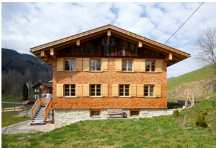
Gold - Private Bauwerke Wohnstallhaus - Nesselwang

Die umfangreichen baulichen Eingriffe an dem im Altstadtensemble gelegenen Gebäude erforderten von den beteiligten Ingenieurinnen und Ingenieuren eine sichere Beherrschung der unterschiedlichsten Bauzustände. Die Rückverformung der stark geschädigten Konstruktion gelang, ohne dass es zum Verlust wertvoller Baubsubstanz gekommen ist. Das Gebäude wird nun als Museum genutzt.