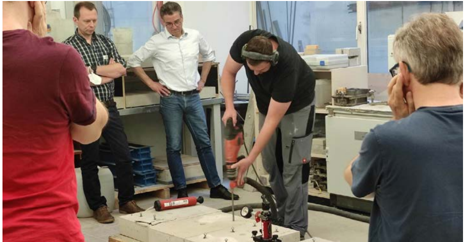
Ein Dübel wird unter den kritischen Blicken der Seminarteilnehmer eingesetzt.