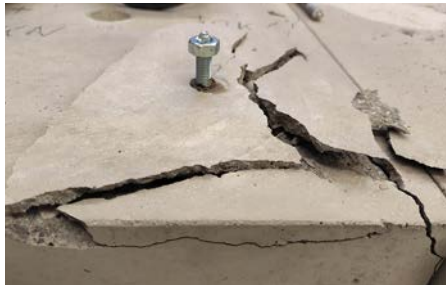
So soll es nicht sein: Risse in der Bausubstanz

Im Mai fand das Seminar "Hält ein Dübel? Befestigungstechnik aus der Sicht der Praxis" erstmalig an der Ingenieurakademie Bayern statt. Aufgrund des großen Interesses gibt es nun einen weiteren Termin am 7. Dezember.