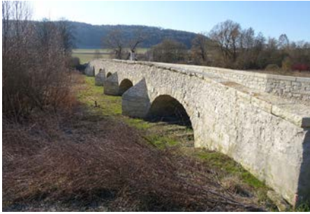
Gold - Öffentliche Bauwerke Altmühlbrücke (Römerbrücke) - Kinding

Insbesondere beim Aufbau des Brückenbelags erfolgte eine detaillierte Betrachtung der unterschiedlichen Materialeigenschaften mit ihren Vor- und Nachteilen. Ein besonderes Augenmerk wurde auf die Dauerhaftigkeit, die Reparaturfähigkeit und die Nutzung regionaler und natürlicher Baustoffe gelegt. Durch die gewählte Instandsetzungsart ist der langfristige Erhalt des Baudenkmals gesichert.