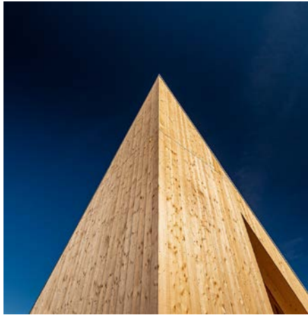
Eine Kapelle ganz aus Holz.

Der Holzbaupreis Bayern, der seit 1972 alle vier Jahre vergeben wird, prämiiert den innovativen, hochwertigen und nachhaltigen Einsatz von Holz in Bauwerken.