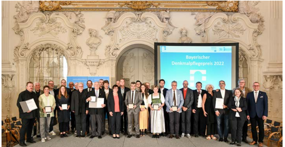
Die Preisträger des Bayerischen Denkmalpflegepreises 2022.