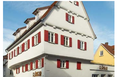
Bronze - Private Bauwerke Wohn- & Geschäftshaus - Günzburg

Im Zuge der Instandsetzung des geschichtsträchtigen Fuchshofes wurden alle statischen Ergänzungs- und Verstärkungsbauteile so konzipiert und umgesetzt, dass sie sich unauffällig und in einer einheitlichen Gestaltung in den historischen Bestand integrieren. Besonders hervorzuheben ist dabei, dass das frei auskragende Vordach ohne sichtbare Unterstützungen erhalten werden konnte.