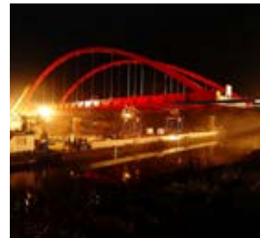
Verschiebung fertiger Brücke