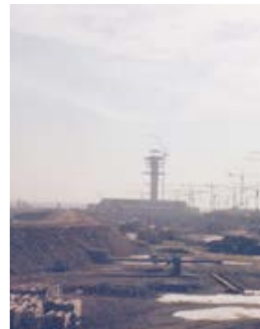
Bau des Flughafen München