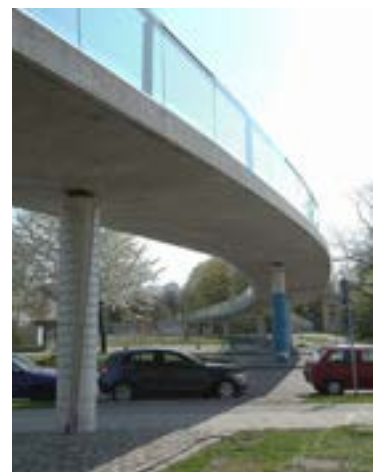
Fußgängerbrücke über die Ackermannstraße