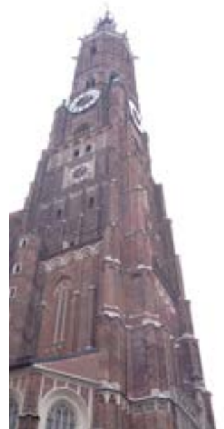
Kirchturm der Martinskirche