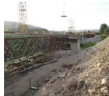
Die Brücke im Bau

Erreichbar über die B 299 (nördlich von Mühlhausen/Sulz gelegen, Zufahrt zur Firma DEHN + SÖHNE). Direkt nach der kleinen Brücke über den Ludwig-Donau-Main-Kanal rechts in die Baustraße abbiegen und am Kanal bis zur Brückenbaustelle entlang fahren.