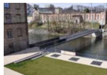
Rosenaubrücke in Kempten