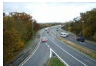
Heinrichsbrücke in Bamberg