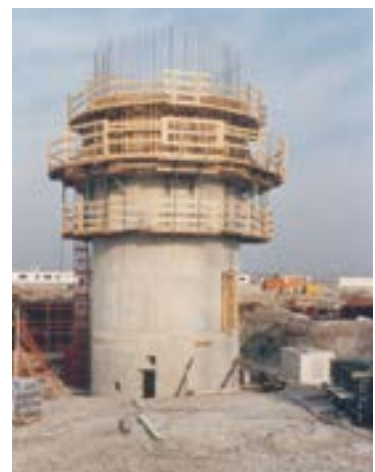
Flughafen-Tower im Bau