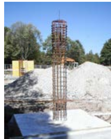
Bau eines Brückenpfeilers