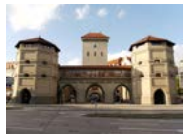
Isartor in München

Alle Infos finden Sie auch online unter bit.ly/bauwerke-bayern .