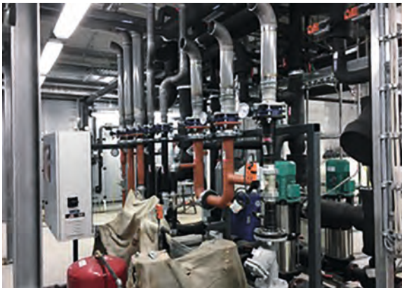
Medienzuführung WRG und Lüftung Chemikum Erlangen