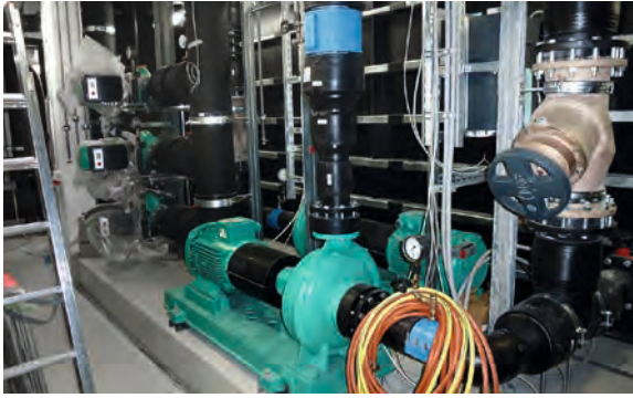
Chemikum Erlangen Kühlwasserpumpe