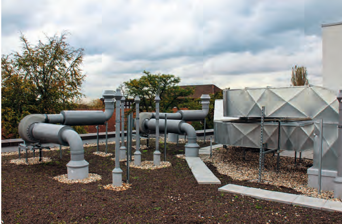
Technikum HRW Sonderabluft Digestorien