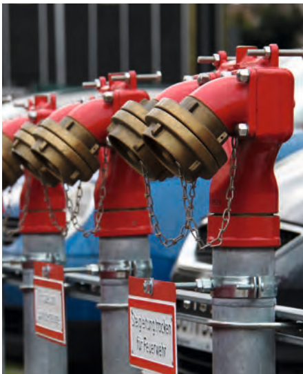
Technikum HRW Einspeisung Löschwasser Resorthotel Berchtesgaden