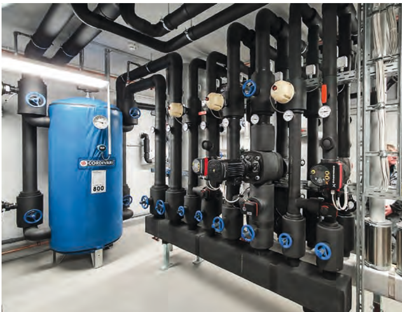
Kälteverteiler und Puffer

Für Aufträge für freiberufliche Leistungen der Ingenieure und Architekten unter dem EU-Schwellenwert liegt die UVgO vor. In Bayern ist von Bundes- und Landesbehörden die UVgO verbindlich anzuwenden. Für den kommunalen Bereich ist die Anwendung freigestellt. Für andere Bundesländer gelten abweichende landesspezifische Regelungen.