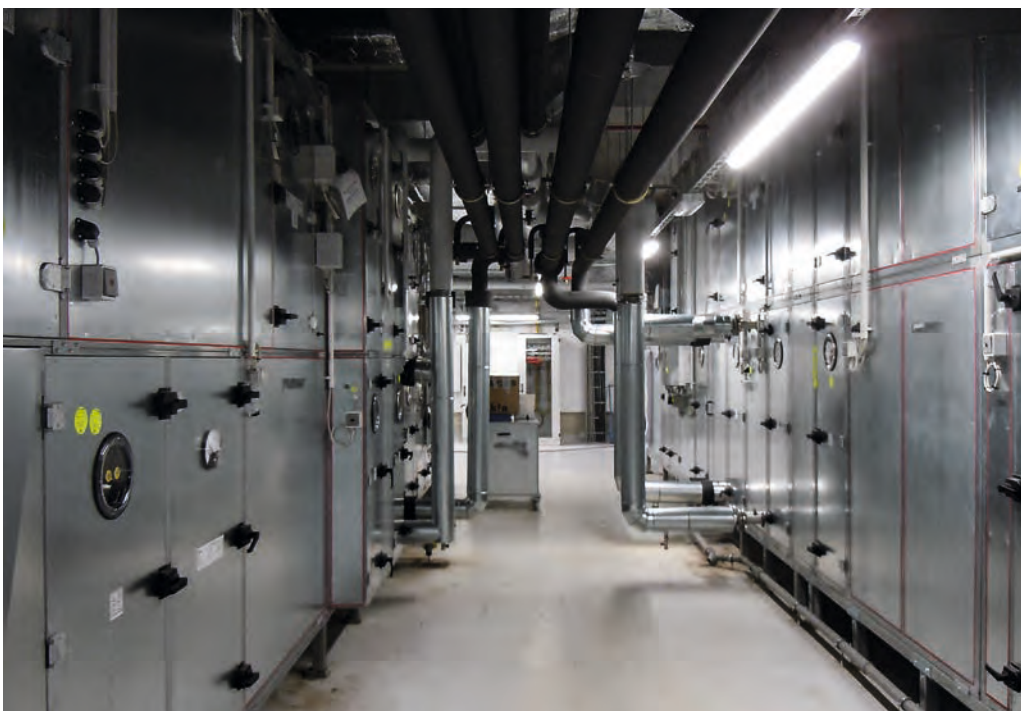
Kongresshotel Stuttgart Lüftungszentrale