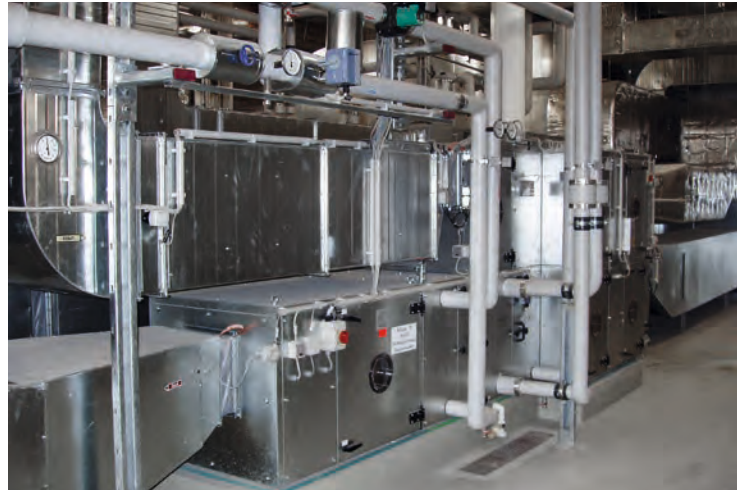
Kongresshotel Stuttgart Lüftungszentrale