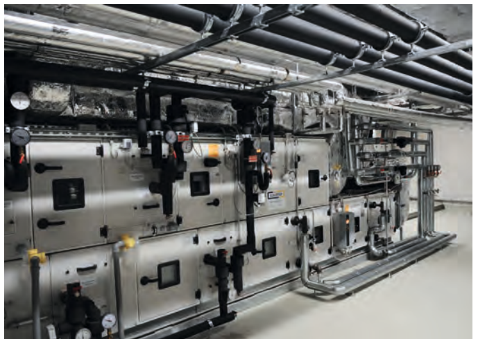
Lüftungszentrale Kongresshalle Augsburg Kontraktor SWA