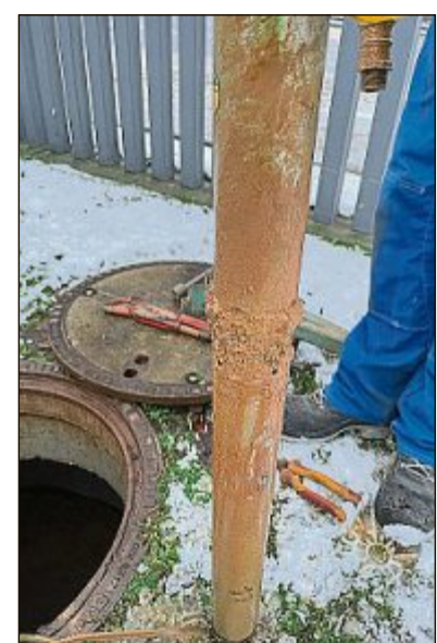
Ausbau einer Tiefpumpe zur Beseitigung der Verunreinigungen durch Verockerung an einer GWRA.

– Ausreichende Laufzeit: Hat die GWRA eine ausreichend hohe