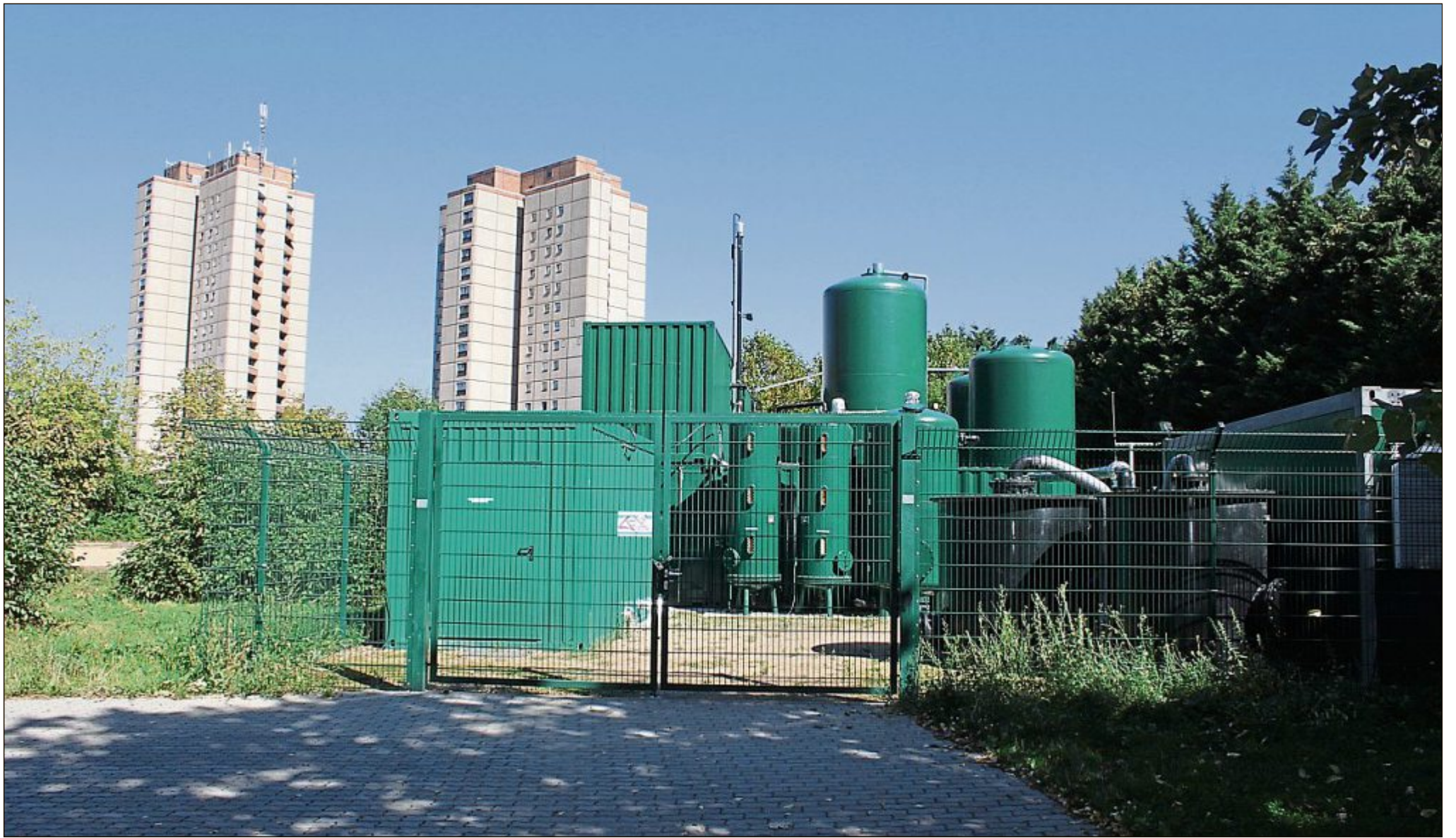
Die Grundwasserreinigungsanlage im Ernst-Thälmann-Park in Berlin-Pankow.

Es gibt allerdings Standorte, an denen Grundwasser bereits gefördert und sogar vorgereinigt wird und an der Oberfläche gesichert verfügbar ist: Anlagen zur Reinigung von belastetem Grundwasser. Könnten hier Wärmenutzungskonzepte ähnlich etabliert werden, wie zum Beispiel mittlerweile im öffentlichen Abwassersystem? Vor diesem Hintergrund untersucht das Ingenieurbüro Team für Technik nach positiven Erfahrungen mit einer bereits umgesetzten Anlage in München das Potenzial solcher Anlagen für die Berliner Gegebenheiten. Hierzu entstand unter anderem eine Masterarbeit. Das Prinzip dabei ist einfach: Wasser aus bestehenden Grundwasserreinigungsanlagen (GWRA) wird nach der Reinigung zusätzlich thermisch genutzt, als Wärmequelle für eine Wasser-Wasser-Wärmepumpe, die wiederum Verbraucher*innen mit Wärme versorgt.