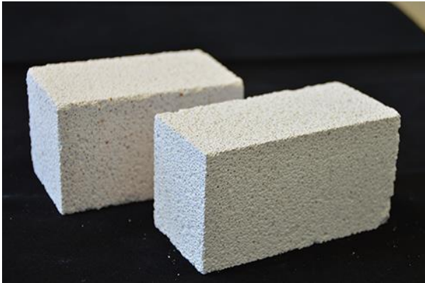
Porenbeton aus Ziegel (hinten), Porenbeton aus Kalksandstein (vorne).