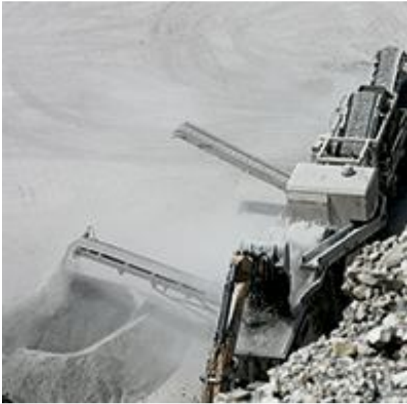
Feinmaterial als kritische Fraktion von Bauabbruch.

----- PRESSEINFORMATION 8. August 2019 || Seite 4 | 5 -----